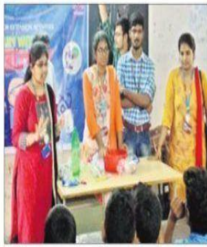
సైన్స్ గురించి వివరిస్తున్న కేఎల్ యూ విద్యార్థులు