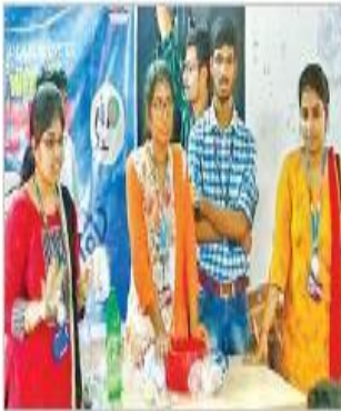
సైన్సులో ఆసక్తిని పెంచుతూ కార్యక్రమంలో వలంటీర్లు

మంగళగిరి, న్యూస్ టుడే: విద్యార్థులు సైన్స్లో ఆసక్తిని పెంచుతూ కేఎల్ డిమ్మ విశ్వవిద్యాలయంలోని సెంటర్ ఫర్ ఎక్సామినేషన్ (సీఈఎ) వంటివి విజ్ఞానకార్యక్రమాలను నిర్వహించారు. మంగళగిరి ఏడవతరగతి