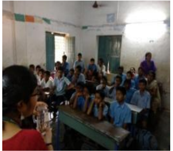
CEA Students explained the results in lack of understanding of basics of science among students