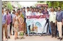
రేవేంద్రపాడులో కేఎల్ యూ ఎన్ఎస్ఎస్ విద్యార్థుల సర్వే

రేవేంద్రపాడు(దుగ్గిరాల), కృష్ణానది: కేఎల్ యూ శాఖకు సేవా విభాగం(ఎన్ఎస్ఎస్) విద్యార్థులు రేవేంద్రపాడులో బుధవారం సర్వే పర్యటనలో నిర్వహించారు. ఆగస్టు ఒకటి నుంచి టిఎం కేటీ వరకు వివిధ గ్రామాల్లో ఈ కార్యక్రమం నిర్వహిస్తున్న సమయంలో ఇటీవలే తెలిపారు. గ్రామంలోని టిఎం కేటీ కట్టలు చేశారు. 10 బ్లాండ్లూగా విడిచిగా ఇంటింటికీ సర్వే నిర్వహించారు. సమస్యలను గ్రామ కార్యకర్తల దృష్టి తీసుకొచ్చే గా పరిష్కారం సాధించి అందించారు.