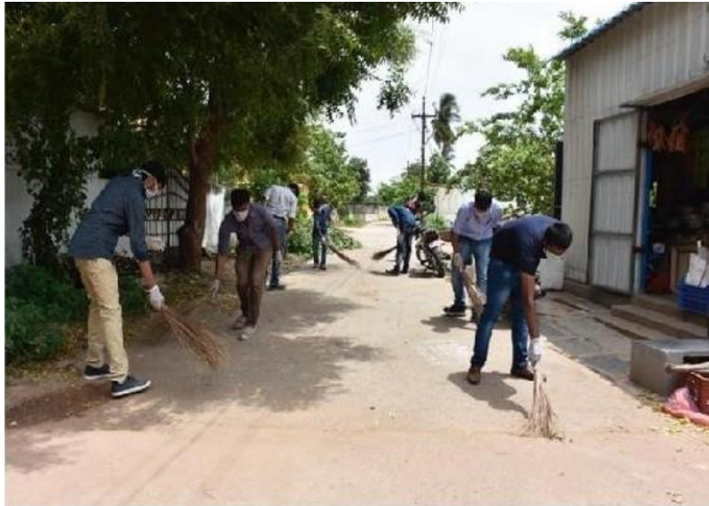
Volunteers Clean the roads at Revendrapadu on 01-08-2018