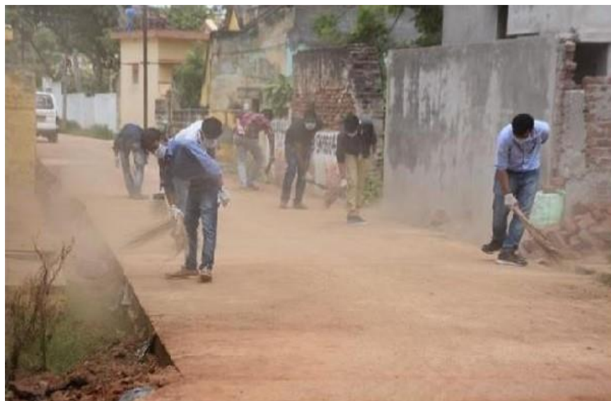
NSS Volunteers conducted the swachh bharaat and clean the roads on 01-08-2018.