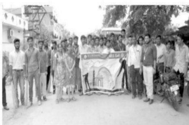
గ్రామంలో రాళ్ళ నిర్మాణాస్తున్న విద్యార్థులు

దుగ్గిరాల, ఆగస్టు 01(ప్రభుత్వం) ప్రజలు ఇంటి పరిసరాల పరిశుభ్రముగా ఉంచుకోవడం ద్వారా వ్యాధుల వ్యాప్తిని అరికట్టవచ్చని విద్యార్థులు వివరించారు. మండల పరిధిలోని రేవేంద్రపాడు గ్రామంలో కొనేరు లక్ష్మయ్య యూనివర్సిటీ ఎన్ఎస్ఎస్ యూనిట్ ఆధ్వర్యంలో గ్రామంలో స్వచ్ఛ భారత్ కార్యక్రమం జరిపారు. గ్రామంలో విద్యార్థులు ఇంటింటికీ తిరిగి ప్రజలకి అవగాహన కలిగించారు. కోఆర్డినేటర్లు, అధ్యాపకులు విద్యార్థులు ఉన్నారు.