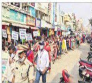
మెయిన్ బజార్ లో ర్యాలీ నిర్వహిస్తున్న విద్యార్థులు