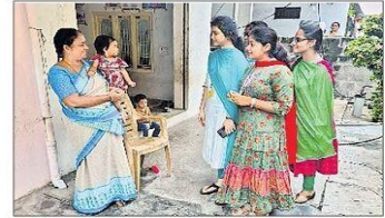
గ్రామస్థులకు అవగాహన కల్పిస్తున్న కేవల్ యూ విద్యార్థులు