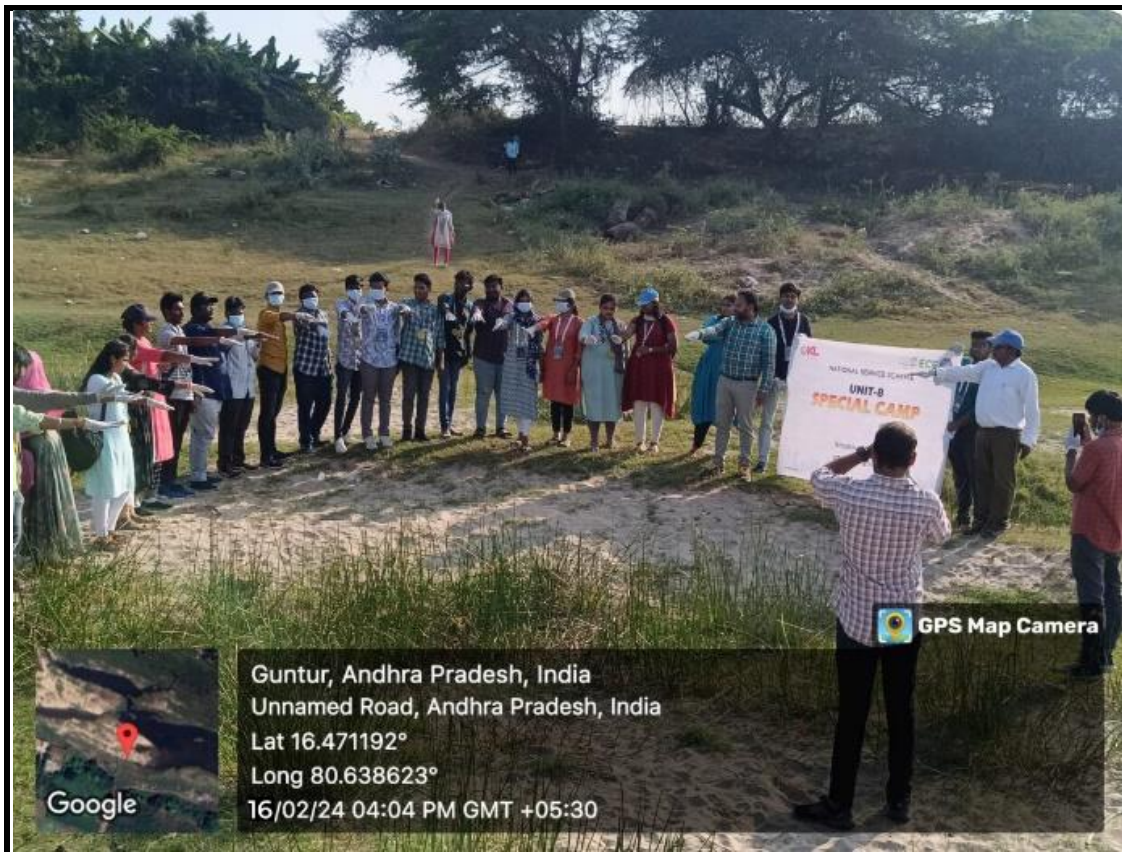
NSS volunteers taking Swachh Bharat pledge