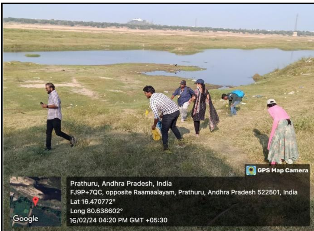
Volunteers removing plastic waste from Krishna River