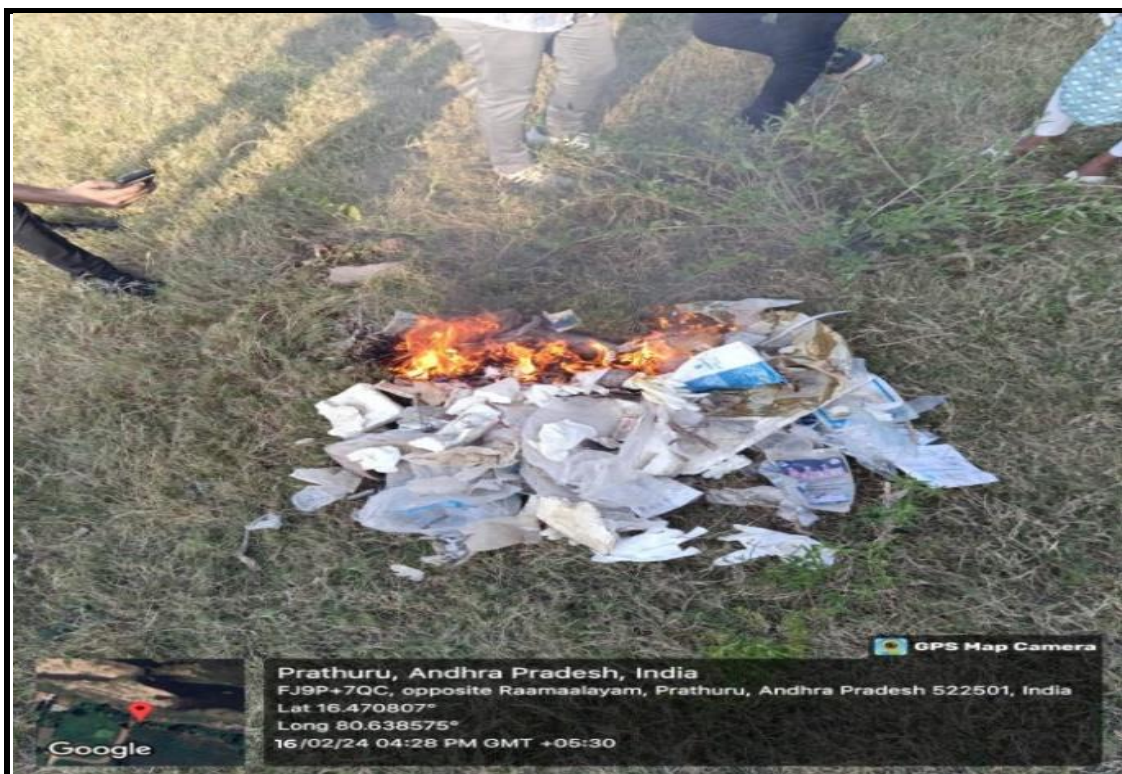
Removing Plastic bottles from Krishna River, A scene of incineration of garbage collected in Krishna River.