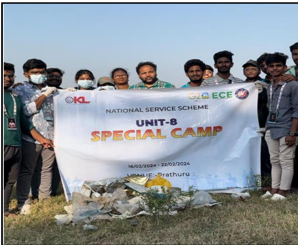
Students removing saplings from Krishna River, A team of NSS volunteers with collected waste