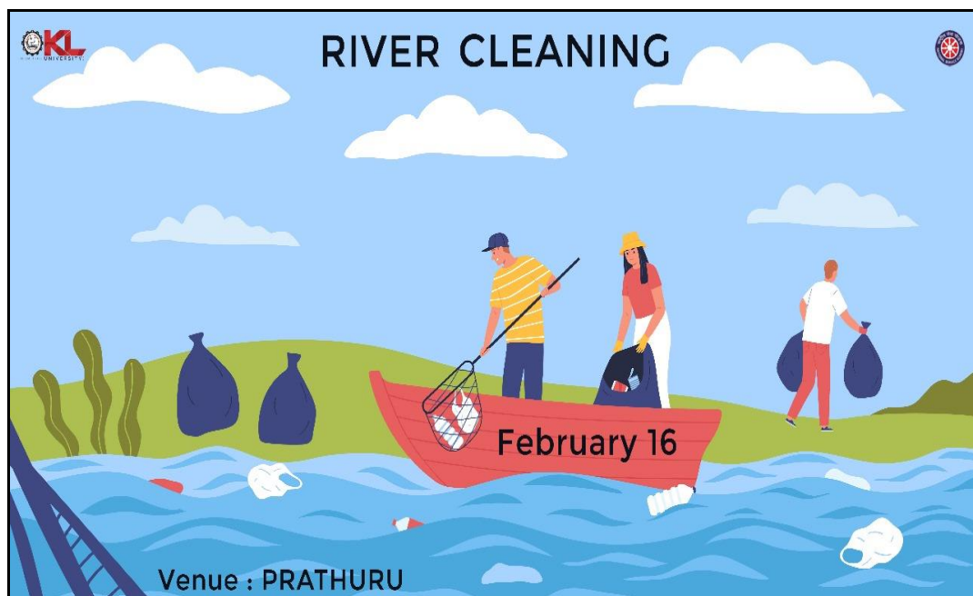
River Cleaning Program Poster