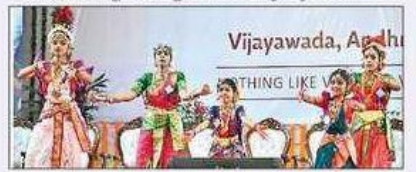
చిన్నారుల స్వచ్ఛ ప్రదర్శన