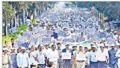
నగరంలో ఓటురు చైతన్య వెల్లువ

విద్యాధరపురం, న్యూస్ టుడే : "ప్రజాస్వామ్యంలో ఓటు వజ్రాయుధం.. ప్రతి ఒక్కరూ చైతన్యమై ఓటుగా నమోదవ్వాలి. త్రికరణ శుద్ధితో ఓటును వినియోగించుకోవాలి.. అవినీతి పీఠమణిచేలా.. ప్రగతి పరిధివిస్తేలా.. ముందడుగు వేసి నవ సమాజ నిర్మాణంలో భాగస్వాములు కావాలని" ప్రముఖులు పిలుపునిచ్చారు.