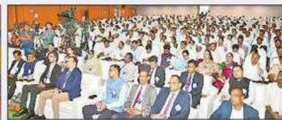
హాజరైన వివిధ జిల్లాల కలెక్టర్లు, అధికారులు, విద్యార్థులు