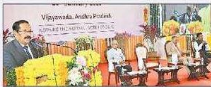
మాట్లాడుతున్న ప్రభుత్వ ప్రధాన కార్యదర్శి విజయనంద్