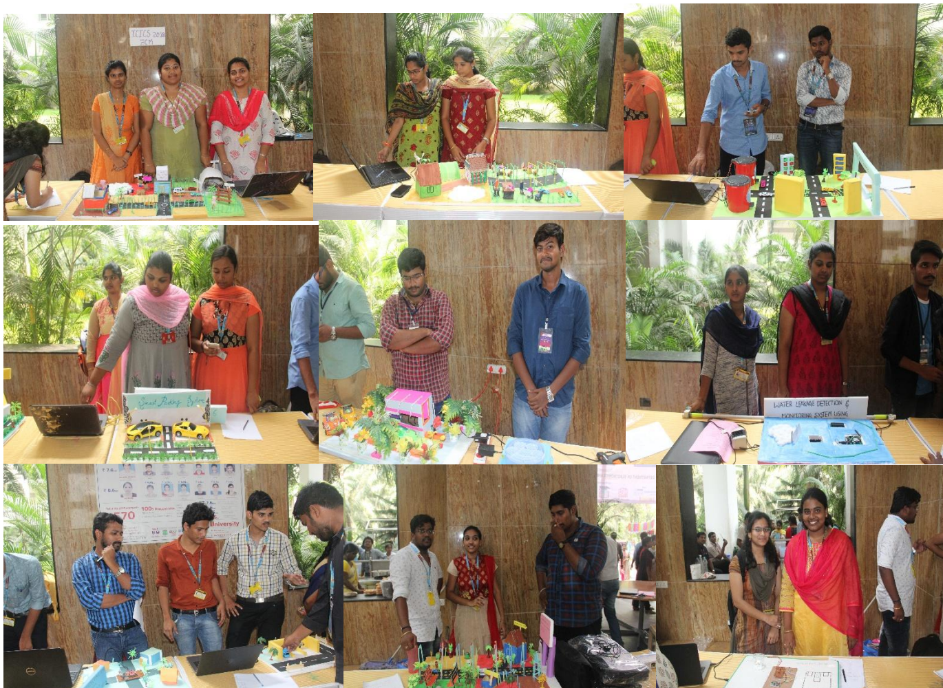
Students demonstrating their project at PROJECT EXPO