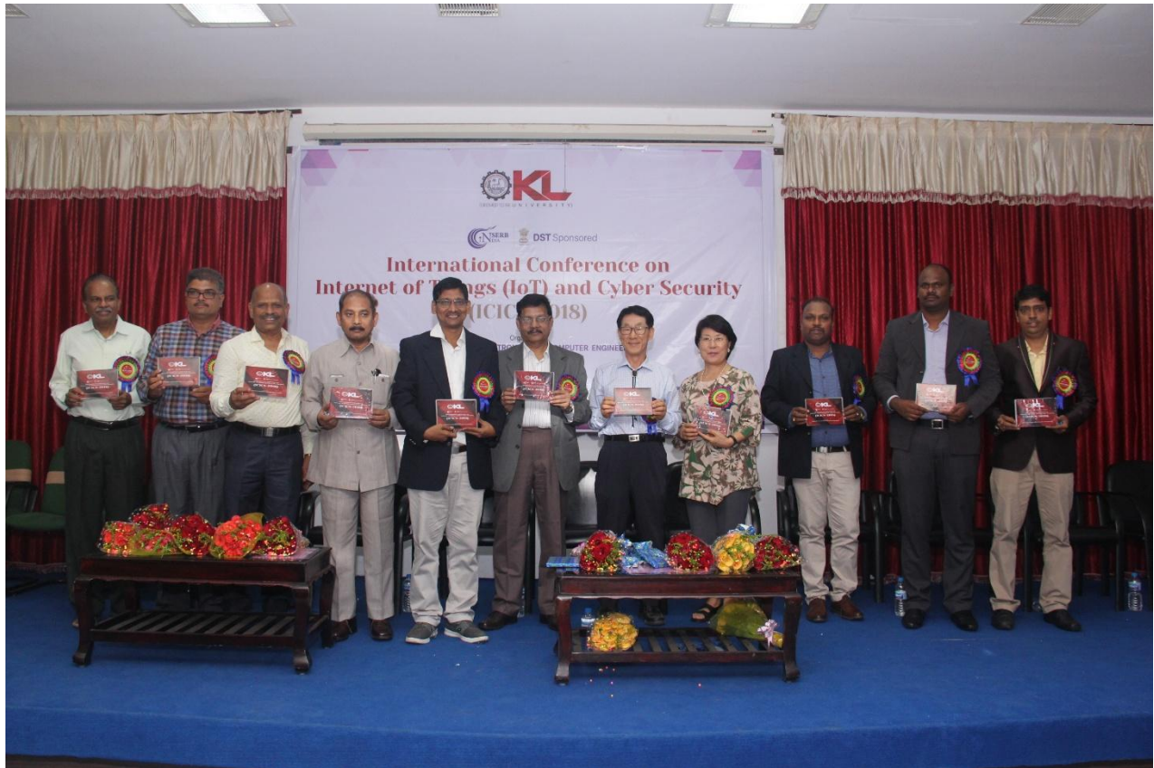
ICICS2018 –Release of Proceedings

The Speakers highlighted the current IoT challenges including security, privacy, scalability, etc. along with other challenges of IoT which include processing, storing, and analyzing the large amount of data that comes from so many different resources. An overview on IoT applications that are extremely useful in our daily life, such as smart cars, home appliances and security, health tracking wearable devices, weather monitors, etc. along with challenges and possible solutions are discussed. The Speakers also stressed on Cyber Security technologies that processes and practices aimed to protect networks, computers, programs and data from attack, damage or unauthorized access.