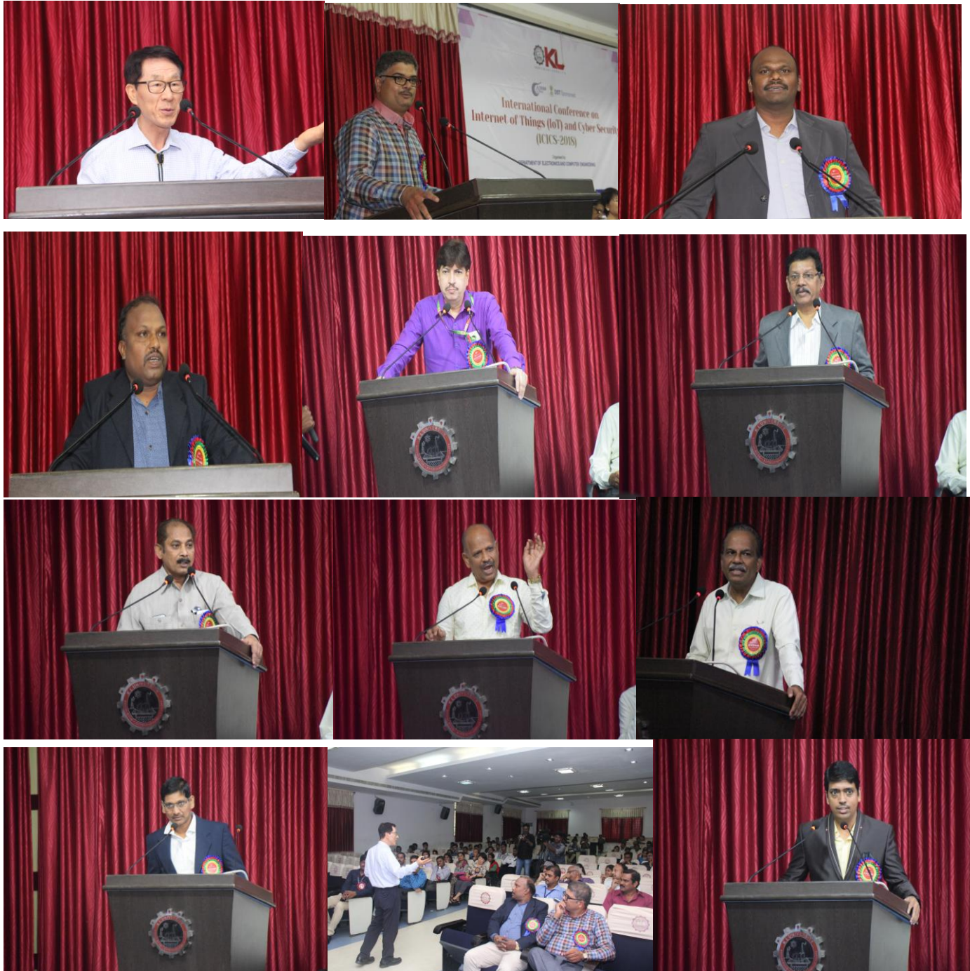
Guests of ICICS2018 Addressing the Gathering

The conference is aimed and focused at bringing together Scientists, industry experts, eminent professors from academia, R&D organizations, research scholars and Students to exchange and share their experiences and research results in all the allied areas of Internet of Things, Embedded Systems, Sensor Networks, Network Security and Cyber Security. ICICS2018 was supported by sponsors from various parts of the state.