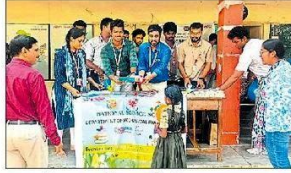
సామగ్రిని అందజేస్తున్న కేఎల్ యూ విద్యార్థులు