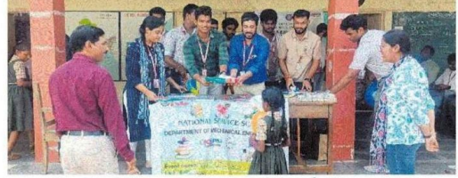
పిల్లలకు నిత్యవసరాలు, విద్యాసామగ్రి పంపిణీ చేస్తున్న దృశ్యం