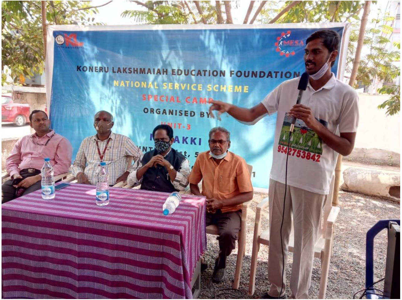
Gathering addressed by KLEF faculty and Panchayat secretary.

INAUGURATION -15<sup>th</sup> February 2021