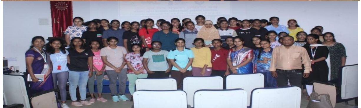
Selection Process by 10 Andhra Girls Bn., PI Staff from on Enrolment Day