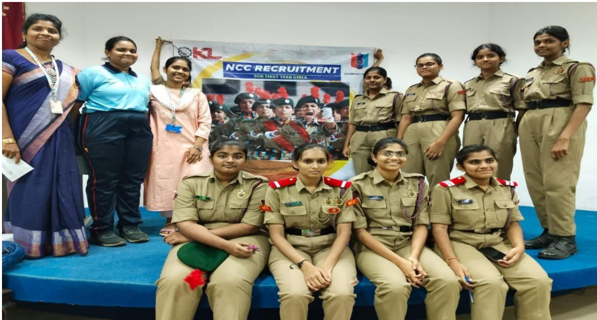
New batch recruitments