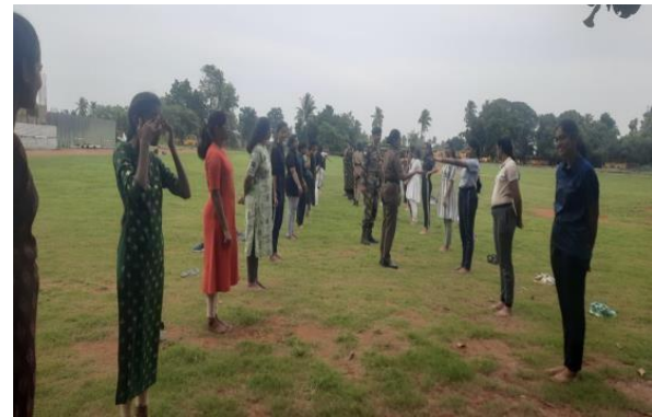
10 Andhra Girls Bn., Y2023 Selected cadets for NCC