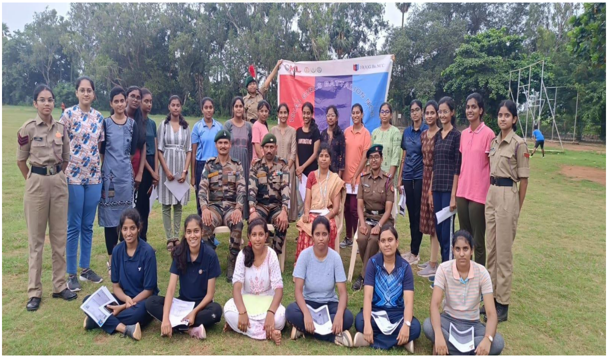
ANO (Associate NCC Officer) 10 Andhra Girls Bn., KLEF along with the GCI-Lavanya and PI Staff with the Selected cadets of Y 23 Batch.

17/09/2023 | Guntur | Page : 12