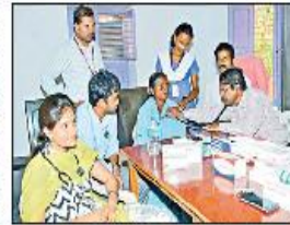
వైద్యశిబిరంలో రోగిని పరిశీలిస్తున్న డాక్టర్లు