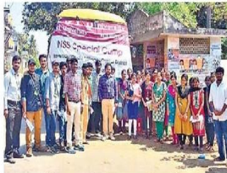
శిబిరానికి వచ్చిన కేఎల్ యూ జాతీయ సేవా పథకం అధ్యాపకులు, విద్యార్థులు