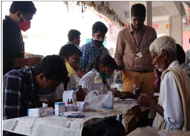
Doctor's and Technicians Testing the Patient's and distributed Medicines