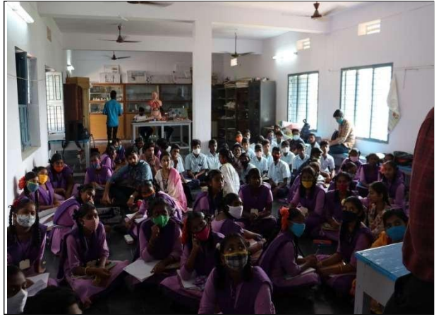
KLUniversityfaculty explainthe CarrierguidancetoZPHSStudents