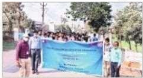
ర్యాలీ నిర్వహిస్తున్న విద్యార్థులు