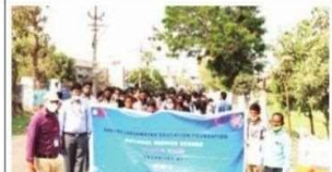
ర్యాలీ చేస్తున్న విద్యార్థులు