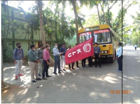
An Awareness on the Drone Technology to Farmers at Nutakki Village