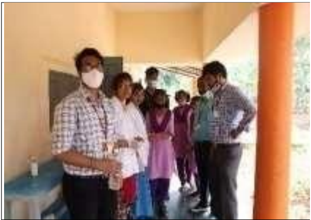
Blood grouping to the Villagers at Nutakki