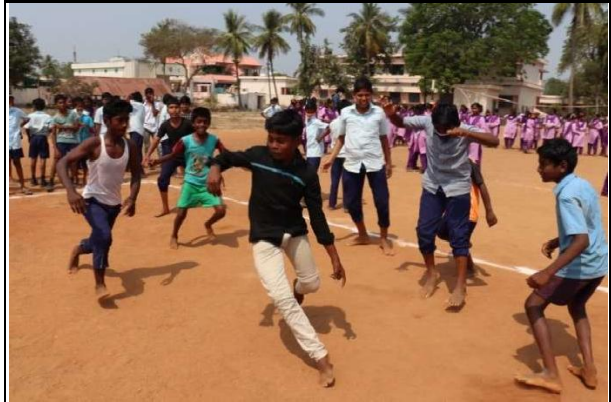
Conducted Games Competition to the ZPHS Students