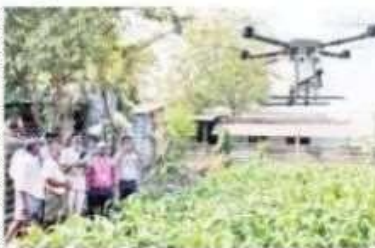
డ్రోన్ తో రైతులకు అవగాహన కల్పిస్తున్న ఇంజనీరింగ్ విద్యార్థులు

మంగళగిరి రూరల్, ఫిబ్రవరి 15: మండలంలోని నూతక్కిలో డ్రోన్ టెక్నాలజీతో పురుగు మందులు పిచికారి చేసి రైతులకు అవగాహన కల్పించారు. కె.ఎల్. యూనివర్సిటీ మెకానికల్ డిపార్ట్మెంట్ ఎన్.ఎస్.ఎస్ యూనిట్-3 ఆధ్వర్యంలో మూడు రోజులు క్యాంపులో బాగాగా మొదటి రోజు గ్రామ పెద్దలు, రైతులతో