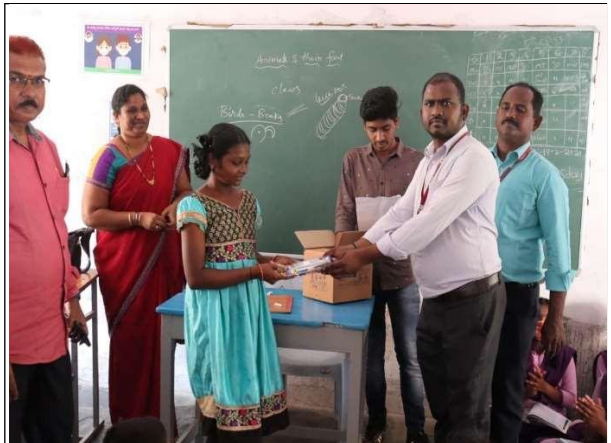
Head Master Distribution of Prizes to Competition winners