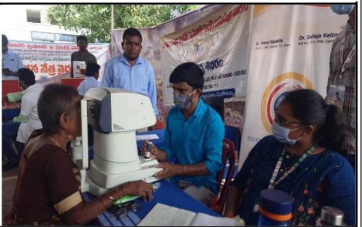
Free medical check-up by students to villagers on 21/01/23