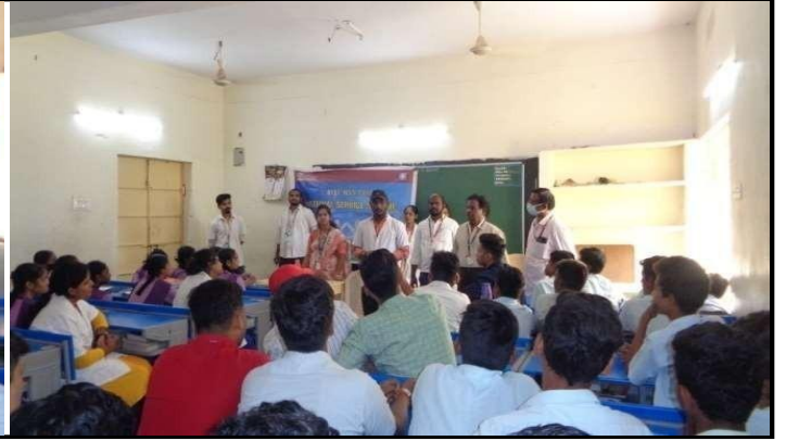
KLEF NSS Programme officer created Awareness on "Drug abuse and Drug addiction"