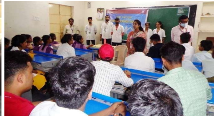
KL University Pharmacy NSS Volunteers and staff giving presentation on Drug abuse & Drug addiction on 04/02/23