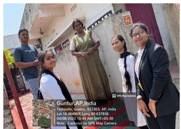
Students creating Awareness about Voter registration 08/04/23