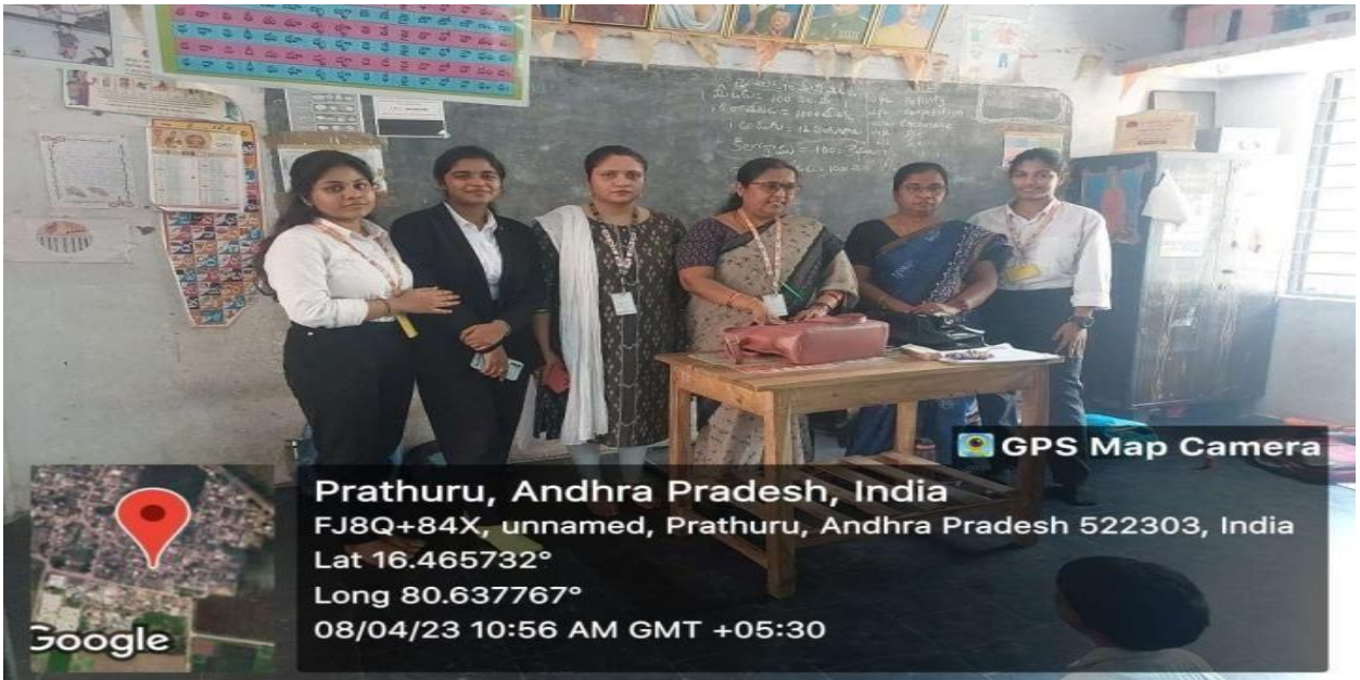
Students creating Awareness about Voter registration on 08/04/23