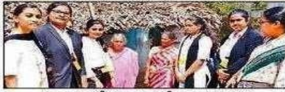
ప్రాతూరులో సానికులతో మాట్లాడుతున్న కేవలీయా లా కళాశాల ఎన్ఎస్ఎస్ విద్యార్థులు

తాడేపల్లి, న్యూస్ టీవీ: ప్రతి ఒక్కరూ 18 ఏళ్ల నుండిన వెంటనే ఓటురుగా నమోదు కావాలని కేవలీయా లా కళాశాల విద్యార్థులు శనివారం ప్రాతూరు గ్రామంలో అవగాహన కల్పించారు. ఓటు ఆవేశ్యకత, దాని విలువ గురించి బంటింటికి వెళ్లి వివరించారు. ఎన్ఎస్ఎస్ పోస్టల్ ద్వారా అర్జులైన ప్రతిఒక్కరూ వ్యక్తిగతంగా మొబైల్ యాప్ ద్వారా ఓటు నమోదు చేసుకోవచ్చని వివరించారు. యాప్ లో ఓటు నమోదు చేయడంపై అవగాహన లేకుంటే.. సమీప సచివాలయంలో కానీ, మీ సేవా కేంద్రంలో కానీ ఓటు నమోదు చేసుకోవచ్చని సూచించారు.