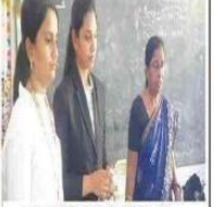
అవగాహన కల్పిస్తున్న ఎన్ఎస్ఎస్ విద్యార్థులు