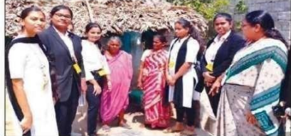
మహాశలకు అవగాహన కల్పిస్తున్న కేవలీయా విద్యార్థులు