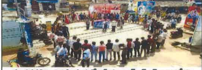
మానవహారం నిర్వహిస్తున్న కేఎల్ యూ ఎన్ఎస్ఎస్ వాలంటీర్లు