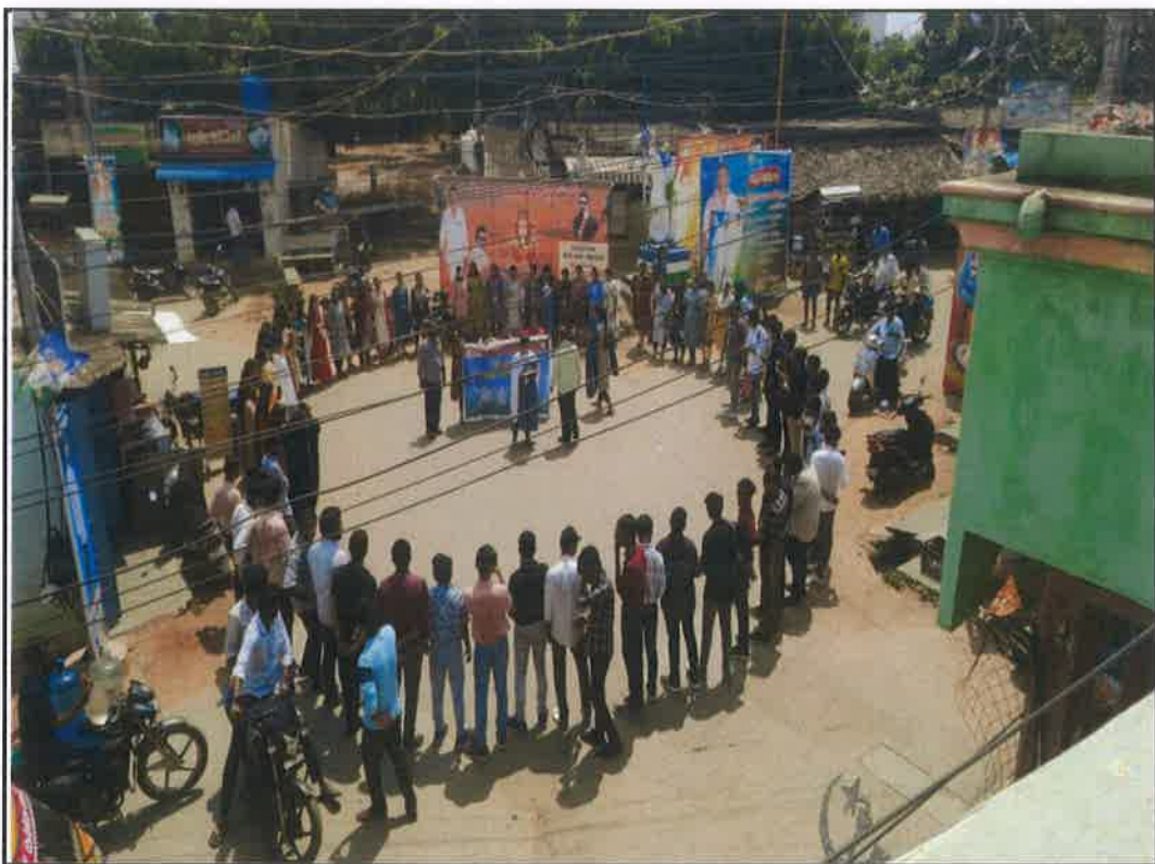
Volunteers forming the human chain for Awareness on Anti-Drugs