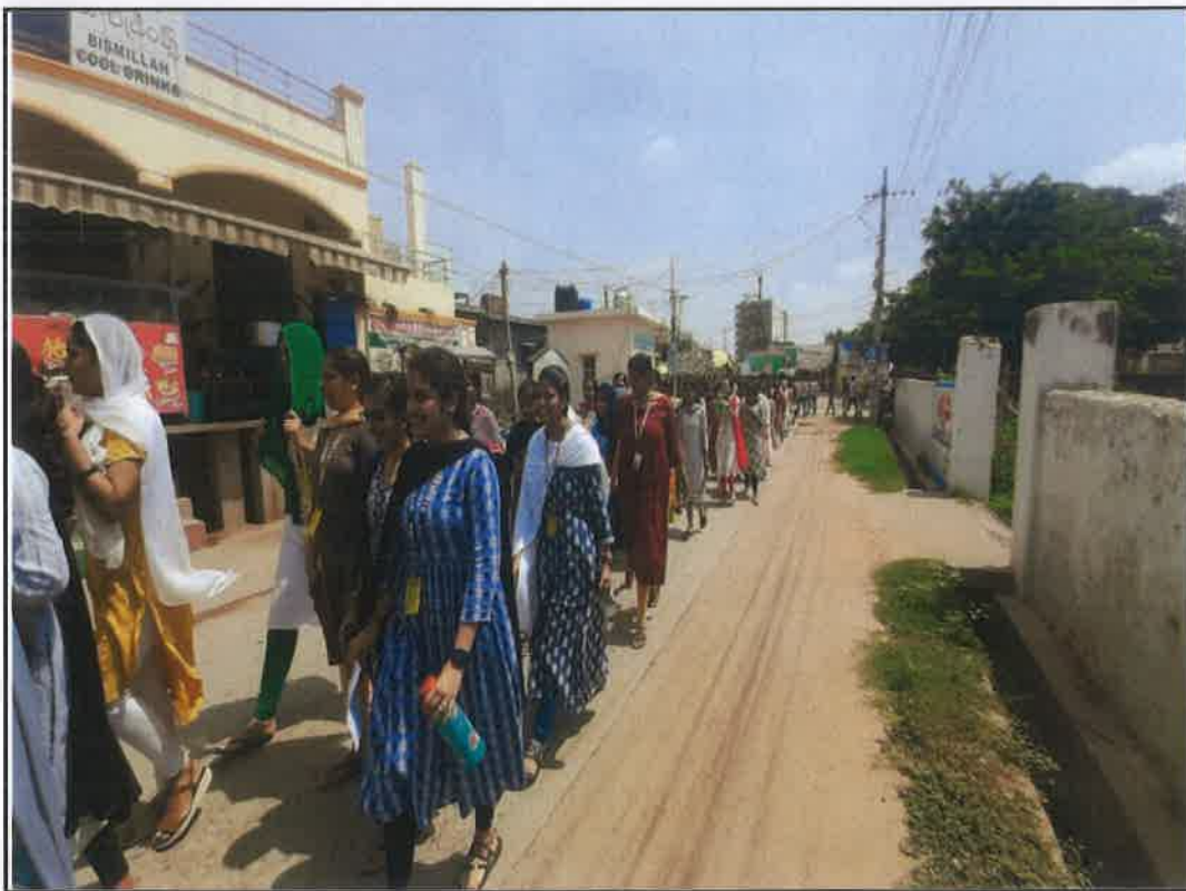
NSS Volunteers rally on Anti-Drugs at Vaddeswaram Village