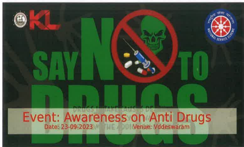
Awareness on Anti-Drugs Poster

We extend our heartfelt gratitude to everyone who participated, contributed, and supported this vital cause. Together, we are making a tangible difference in our community.