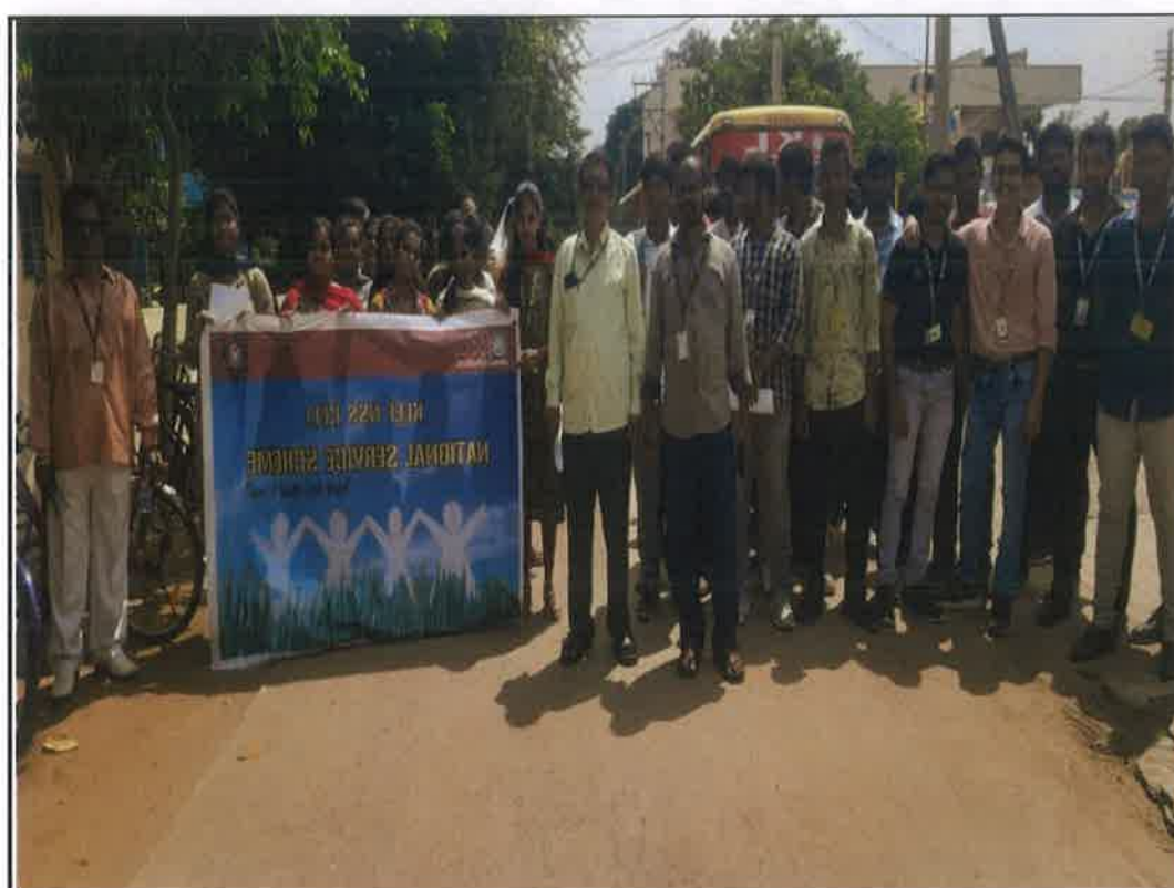
KLEF NSS Volunteers started the rally on Anti-Drugs