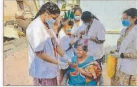
గ్రామస్థులకు రక్తపరీక్షలు నిర్వహిస్తున్న కేఎల్ యూ ఫార్మసీ కళాశాల విద్యార్థులు