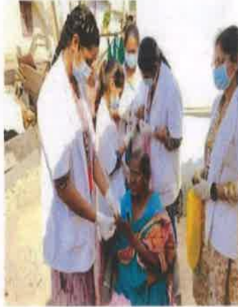
రక్తపరీక్షలు చేస్తున్న వైద్య సిబ్బంది