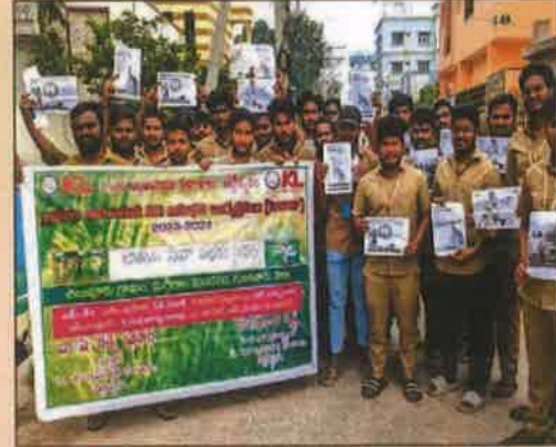
అవగాహన ర్యాలీ నిర్వహిస్తున్న కేవల్ యూ విద్యార్థులు