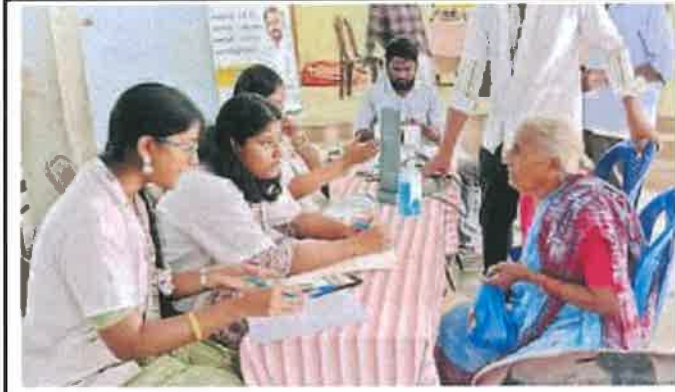
గ్రామస్థులకు వైద్యపరీక్షలు నిర్వహిస్తున్న వైద్యులు