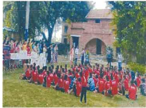
నిత్యావసరాలు అందజేస్తున్న కెఎల్ యూ ఎన్ఎస్ఎస్ వాలంటీర్లు