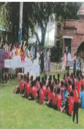
వరదలోని వరద బాధితులకు కూడా అందచేయ నున్నట్లు ఆయన వివరించారు. వరద ప్రభావితులకు తమ వంతు సాయంగా నిత్యావసరాలను అందించిన ప్రతి ఒక్కరికి