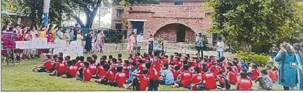
నిత్యావసర సరుకులు, పుస్తకాలు పంపిణీ చేస్తున్న కేఎల్ యూ విద్యార్థులు