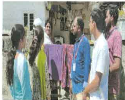
వైద్యుడు ముద్దమిది చికిత్స తీసుకోవాలని విద్యార్థి విభాగధిపతి రాకర్ తెలిపింది.

హత్య - మంగళగిరి ప్రస్తుత కాలంలో వాతావరణంలో వ్యాధులపట్ల తీసుకోవాల్సిన జాగ్రత్తలను రోజురోజుకూండా మార్పుల కారణంగా వచ్చే సీజనల్ వ్యాధులపట్ల అప్రమత్తంగా ఉండి పరిసరాలలో శుభ్రత కొల్పాలి. ప్రతి ఒక్కరూ ప్రత్యేక శుభ్రతతోపాటు పరిసరాల పరిశుభ్రత కూడా పాటించాలి. కెఎల్ యుఎస్ఎస్ఎస్ వాలంటీర్లు కుంటేలు, నీటి తొట్టెలు ఉంచరాదని, అవే రోజులకు అవసరంగా మారతాయని, ప్రమాదకరమైన కెంగ్రూ మలేరియా, చికెన్ గున్యా వంటి జ్వరాలకు కారణమవుతాయని, రెండు మూడు రోజులకు పెరకొందూ గ్రామంలో ఎన్ఎస్ఎస్