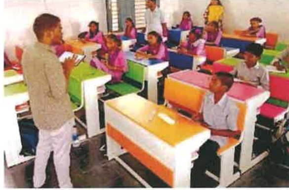
పోటీలు నిర్వహిస్తున్న కెఎల్ యూ విద్యార్థులు