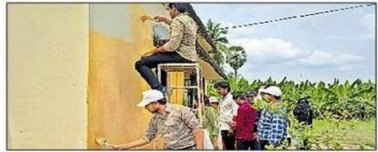
రంగులు వేస్తున్న కేవల్ యూనివర్సిటీ విద్యార్థులు