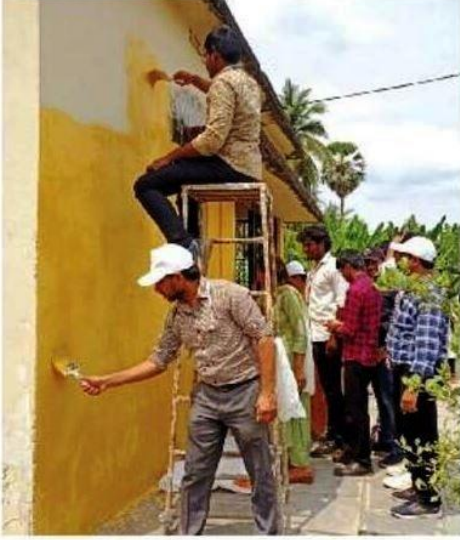
అంగన్వాడీ స్కూల్ కి రంగులు వేస్తున్న ఎన్ఎస్ఎస్ వాలంటీర్లు