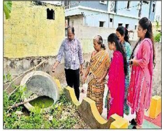
గ్రామస్థులకు అవగాహన కల్పిస్తున్న కేఎల్ఎంఎం విద్యార్థులు