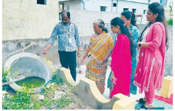
తొట్టెలో నిల్వ ఉన్న నీటిని బయటకు పంపుతున్న కేఎల్ యూ ప్రతినిధులు