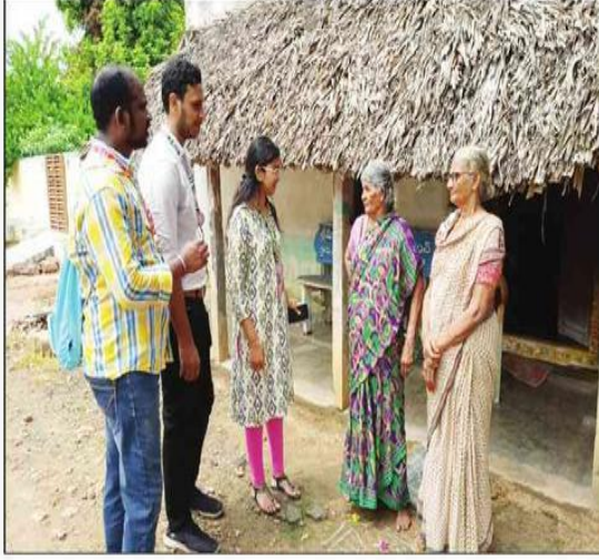
గ్రామస్థులకు అవగాహన కల్పిస్తున్న కెఎల్ యు విద్యార్థులు