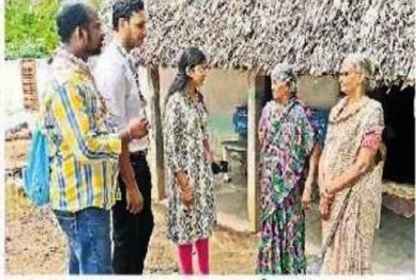
గ్రామస్థులకు అవగాహన కల్పిస్తున్న కేఎల్ఎస్ విద్యార్థులు