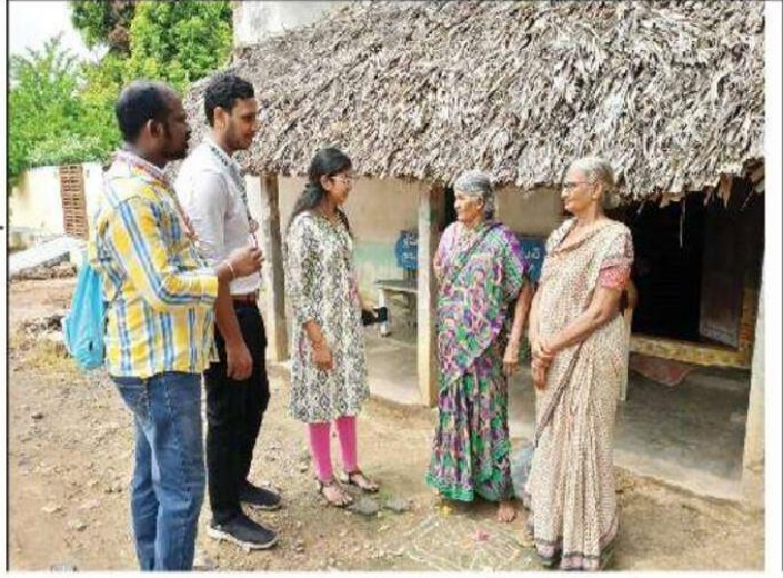
గ్రామస్తులకు అవగాహన కల్పిస్తున్న కెఎల్ యూ విద్యార్థులు