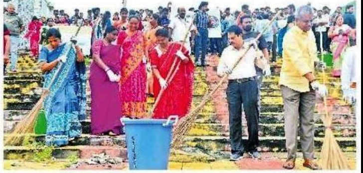
సీతానగరం ఘాట్ వద్ద పారిశుధ్య కార్యక్రమంలో పాల్గొన్న ఎంటీఎంసీ అధికారులు, స్థానికులు