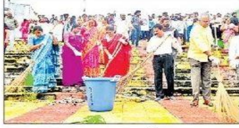
పుష్కర ఘాట్లను శుభ్రం చేస్తున్న దృశ్యం

మంగళగిరి టౌన్ / తాడేపల్లి రూరల్: పర్యావరణాన్ని కాపాడు కుంటేనే భవిష్యత్ తరాలకు ఆరోగ్యకర సమాజాన్ని అందించగలమని ఎంటీఎంసీ కమిషనర్ అలీమ్ బాషా స్పష్టం చేశారు. తాడేపల్లి పట్టణ పరిధిలోని సీతానగరంలో ఏక్డిన్.. ఏక్ గంట... ఏక్ సాత్ కార్యక్రమంలో భాగంగా పరిసరాల పరిశుభ్రత పనులను గురువారం నిర్వహించారు. ఇందులో భాగంగా ప్రకాశం బ్యారేజ్ సమీపంలోని సీతానగరం పుష్కర ఘాట్లలో