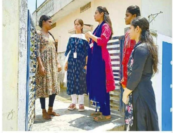
పెదకొండూరులో అవగాహన కల్పిస్తున్న కెఎల్ యూనివర్సిటీ విద్యార్థులు