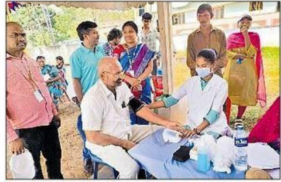
వైద్య పరీక్షలు చేస్తున్న డాక్టర్లు